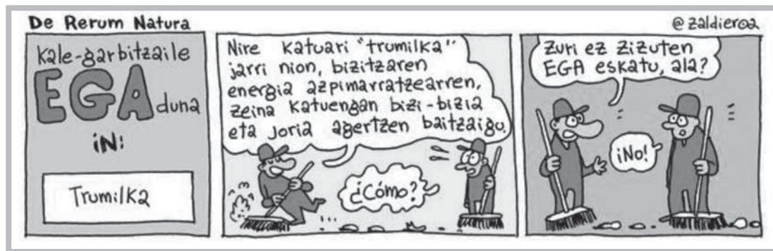
Iturria: Zaldieroa, Berria, 2017/03/01.

Indarrean den legealdian, administrazioiko lanpostuen zerrendaren balioespen berri bat egin du Jaurlaritzak, Gobernuaren arabera, disfuntzioak 9 gertatzen ari direlako, euskara gaitasun maila jasoak eskatzen omen direlako, lanposturako hizkuntza formala behar ez denetan.